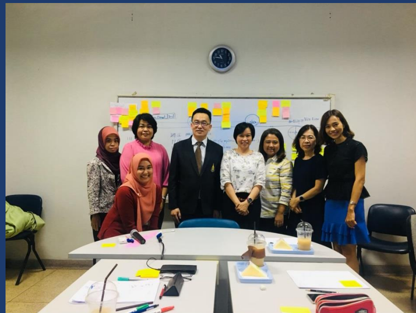
การพัฒนาความคิดเชิงระบบเพื่อประสิทธิภาพ ในการทำงานวิจัย (Design thinking Workshop)