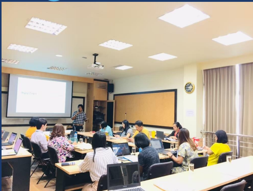
อบรมเชิงปฏิบัติการเพื่อพัฒนาสื่อการเผยแพร่ งานวิจัยด้วย Info graphic